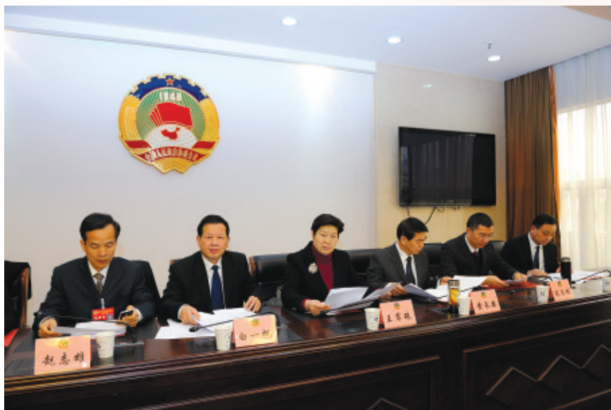
市政协十二届十七次主席会议