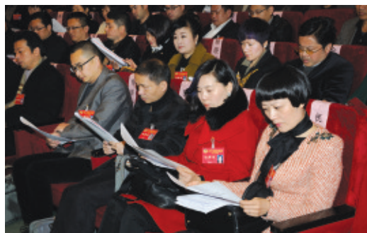
委员认真听取常委会工作报告