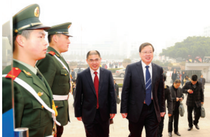
李无文市长出席两会