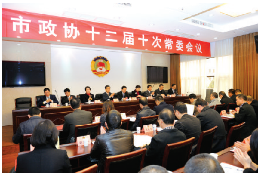
市政协十二届十次常委会