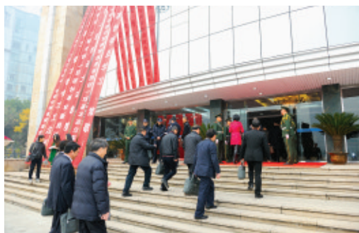
委员纷纷步入会场