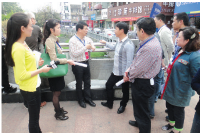
市政协人口资源环境委员会开展“五水共治”专项民主监督活动。黄长安副主席参加。

市政协城乡建设委员会、人口资源环境委员会组织政协委员开展城镇低效用地再次开发利用专题调研。方小梅副主席参加调研。