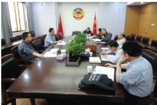
市政协文史资料委员会召开《过去的岁月》编辑工作座谈会。