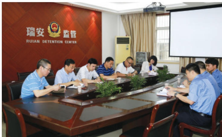
市政协委派市人民检察院民主监督小组视察驻所检察室。