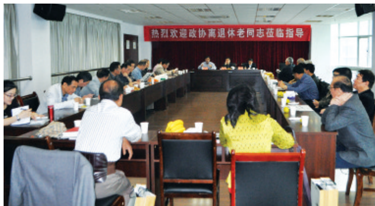
市政协离退休党支部暨之友社第四组赴市文联活动。