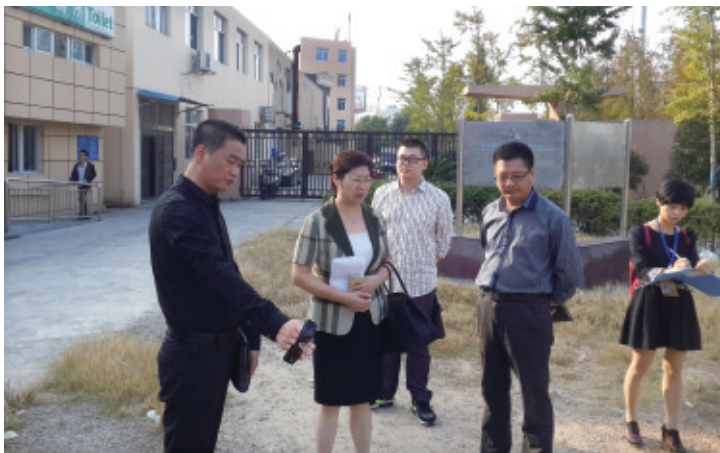
市政协视察我市户外体育健身路径建设情况,王翠珠副主席参加。